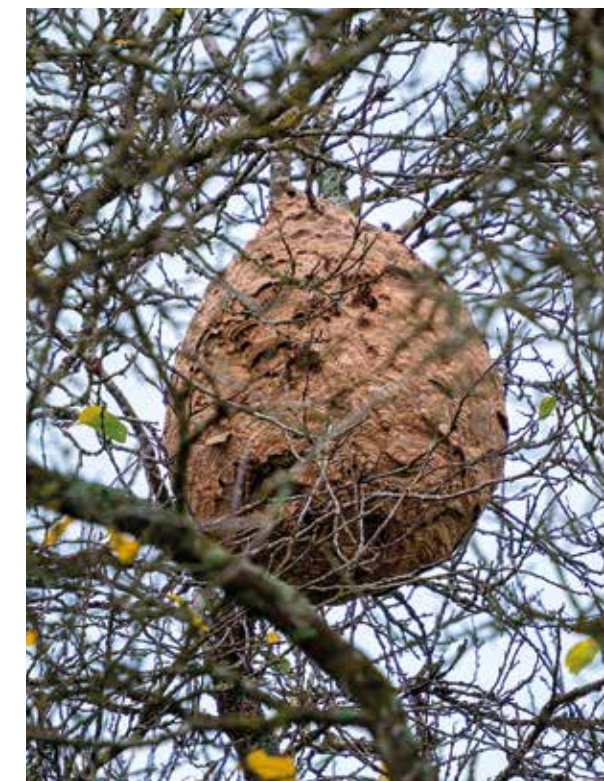
Nids de frelons avant traitement, situé rue des Vergers.