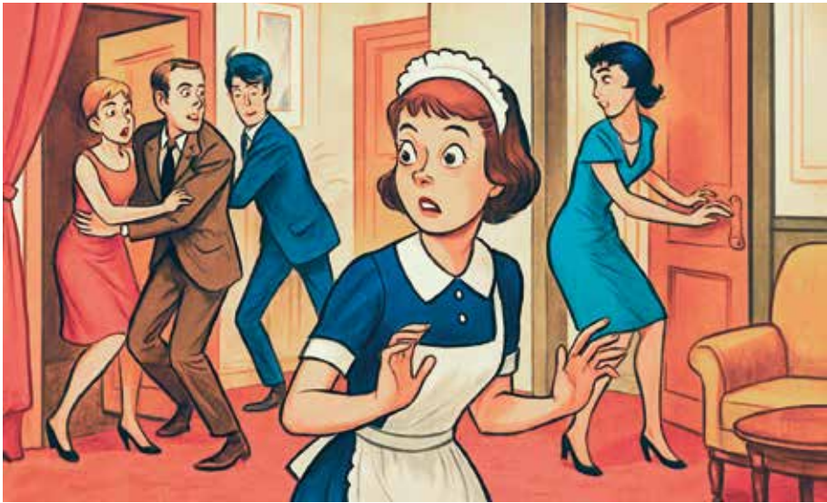
17/04/2026 Théâtre "La bonne Anna" par "Les Baladins du Val Sierckois"