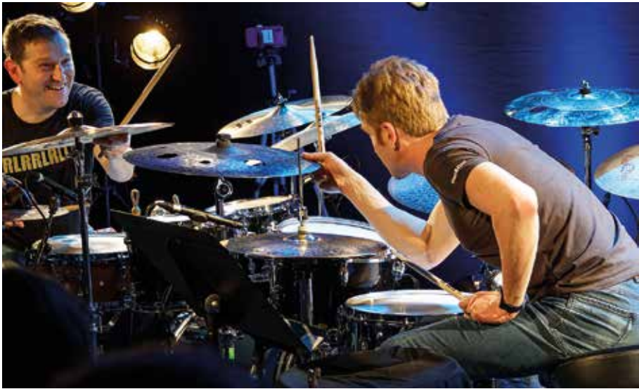
07/06/2026 Concert "Rythmology 2 drums"