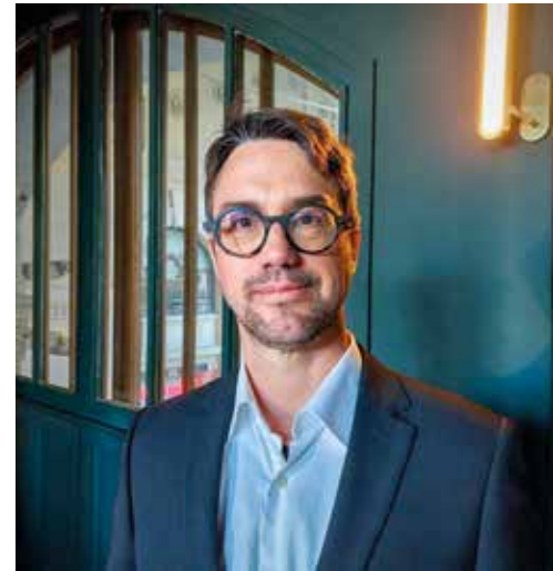
23/01/2026 Conférence "Les enfants dans le monde numérique"