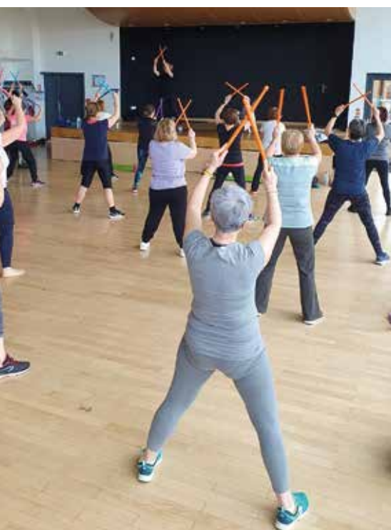
photo Bouger à Kanfen

L'association a fait découvrir de nouvelles pratiques sportives