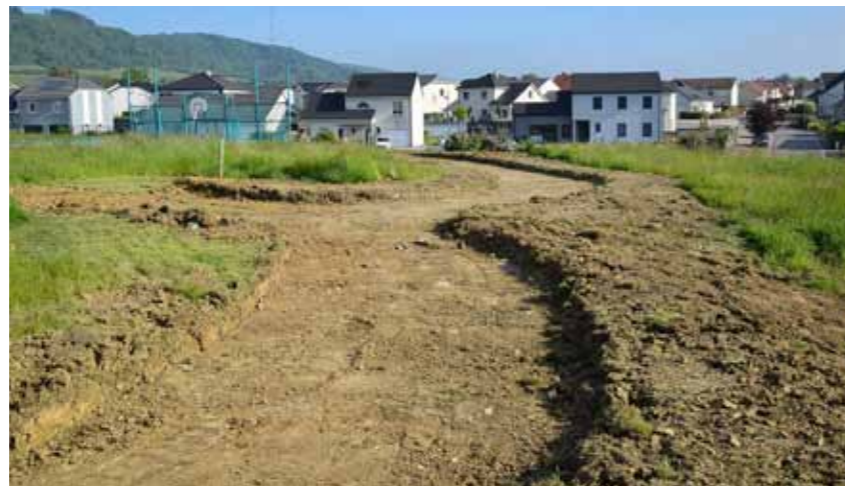
Les chemins naissent les uns après les autres à l'arrière de l'espace socioculturel

Les travaux ont débuté à l'arrière de l'espace socioculturel