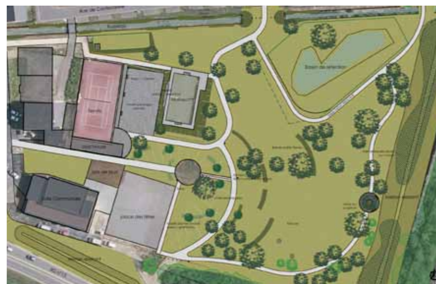
Le plan ci-dessus présente le projet d'aménagement du terrain situé à l'arrière de l'espace socioculturel. On peut y voir les chemins en béton désactivé qui formeront le squelette du futur parc paysager pédagogique. De nombreux arbres, pelouses et prairies fleuries y seront plantés. Trois zones seront aménagées pour créer un site où il sera plaisant de flâner et apprendre.