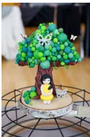
Le public a pu découvrir le talent de nombreux artisans. Photo ci-dessus : de superbes petits personnages réalisés en pâte flymo par Fimotzé Créations

En effet, le salon propose de venir à la rencontre d'artisans qui mettent en avant la richesse des métiers de l'artisanat. Ce marché est porteur - on parle de plus en plus de circuits courts, de produits locaux - malheureusement peu de visiteurs se sont déplacés ce week-end là. Pourtant les créations proposées à la vente étaient diversifiées et de qualité : travail sur bois, maroquinerie, poteries et sculptures, confections en tissus, etc. Il y en avait pour tous les goûts et tous les âges. Les ateliers de démonstration et d'exposition étaient autant d'animations qui favorisent la découverte en famille et la convivialité.