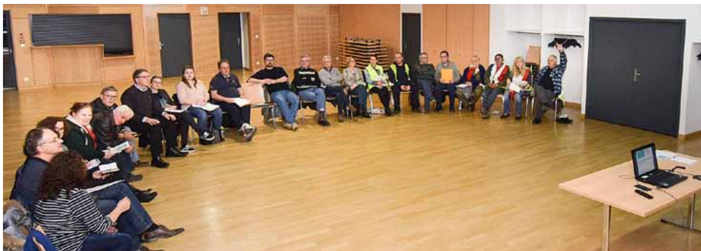
Grand Débat National : réunion publique à Kanfen le 22 février 2019 sur le thème de la transition écologique

a fait le choix de compléter le cahier de doléances par une consultation publique au cours de quatre réunions ; chacune étant consacrée aux thèmes officiels. Ces soirées tenues entre le 8 février et le 1 er mars, ont attiré, à chaque fois, une vingtaine de personnes. L'auditoire se composait de Kanfenois mais aussi d'habitants venus de villages environnants qui ont pu débattre de manière constructive. Au final, une centaine de propositions ont été enregistrées.