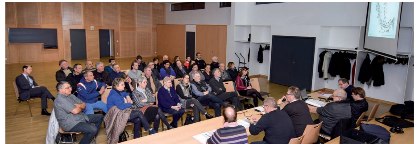
Les résidents des rues Jeanne d'Arc et Schuman ont été conviés le 10 janvier 2018 à la présentation du projet d'aménagement de leur rue.

La commune a invité les résidents des rues Jeanne d'Arc et Schuman à découvrir le projet d'aménagement programmé pour 2018