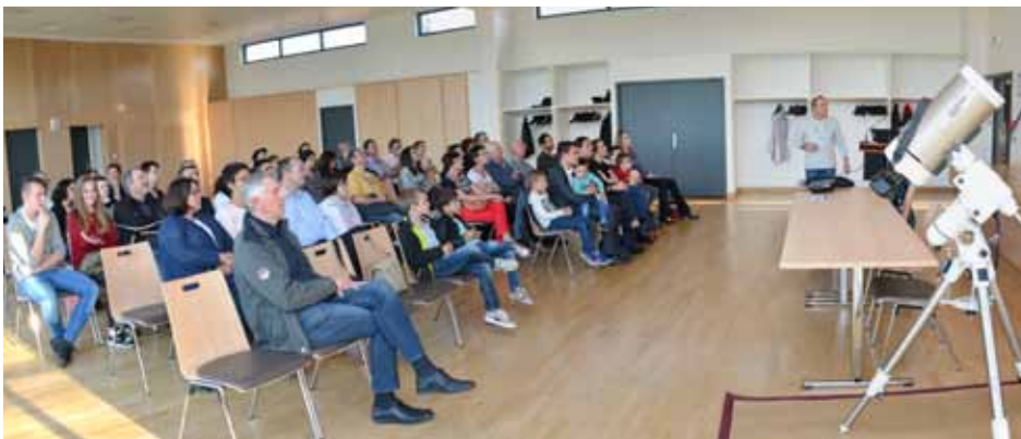
L'association « La Grande Ourse » a exposé des télescopes très impressionnants

L'assemblée a passé une soirée « la tête dans les étoiles »