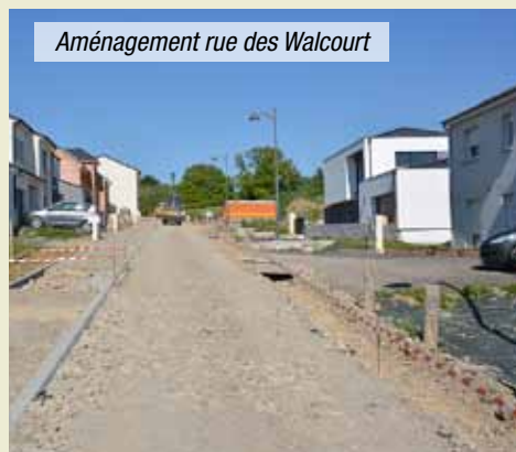
Aménagement rue des Walcourt