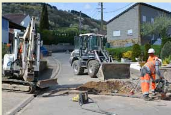
Enfouissement des réseaux rues du Lavoir et de la Liberté

débuté avec la création des voies de circulation. Les 13 parcelles qui constitueront ce nouveau lotissement ont toutes été vendues, la priorité a été donnée aux Kanfenois.