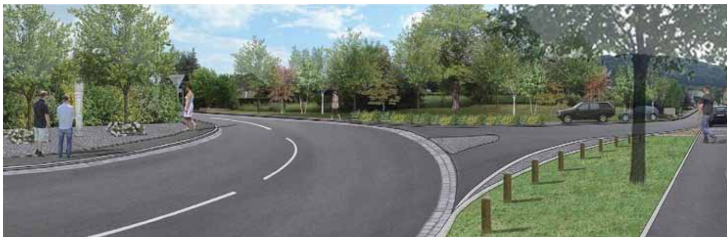
Vue 3D du carrefour à l'intersection des rues du Moulin, de Volmerange et Jeanne d'Arc où un « stop » sera installé.

Jeanne d'Arc et de Volmerange sera réaménagé et un « stop » sera mis en place afin de donner la priorité à l'axe