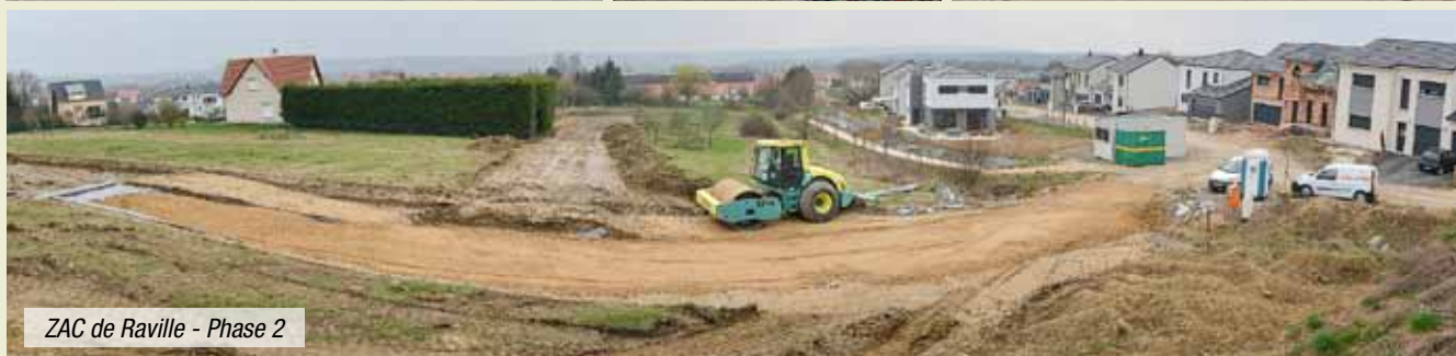
ZAC de Raville - Phase 2