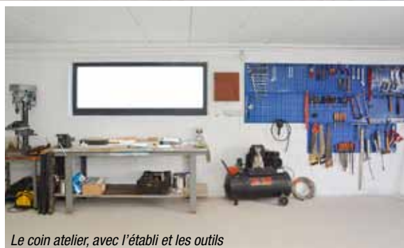
Le coin atelier, avec l'établi et les outils

Les agents des services techniques ne sont pas oubliés : des douches, vestiaires, sanitaires et coin repas sont également prévus.