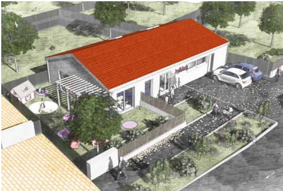
Vue du projet de la micro-crèche située à proximité de l'école maternelle

Une initiative privée à l'origine de cette création