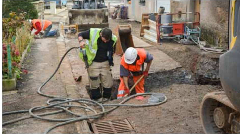
Les travaux d'assainissement rue de la République

Vous avez sans nul doute remarqué les travaux de voirie menés par la Communauté de Communes de Cattenom dans les rues de Volmerange, puis du Moulin, du Lavoir, de Zoufftgen et maintenant dans les rues de la Mairie et de la République. Ils se poursuivent actuellement rue de la Kissel jusqu'au poste de refoulement rue du Chemin de Fer. Ils concernent l'assainissement de