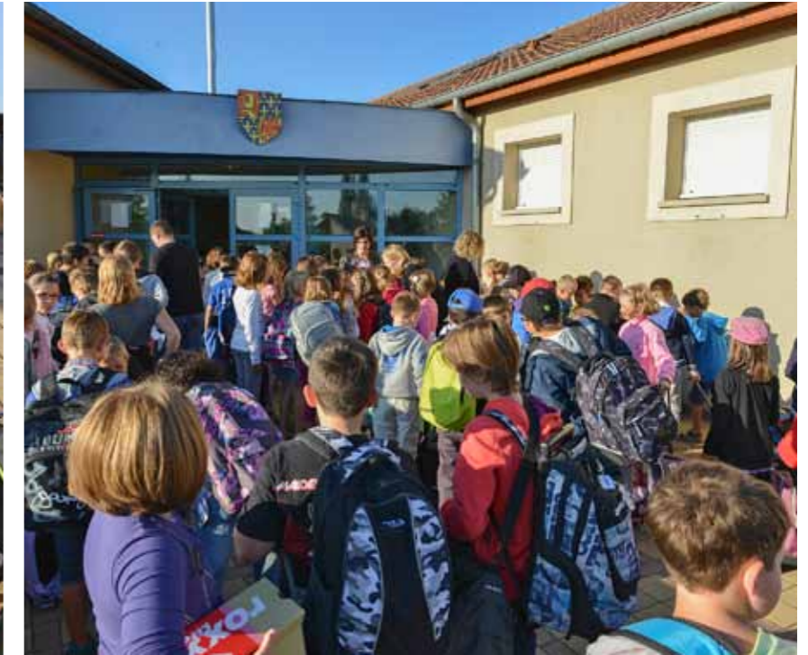
8 h 30 : La cloche vient de sonner, il est temps de rentrer...