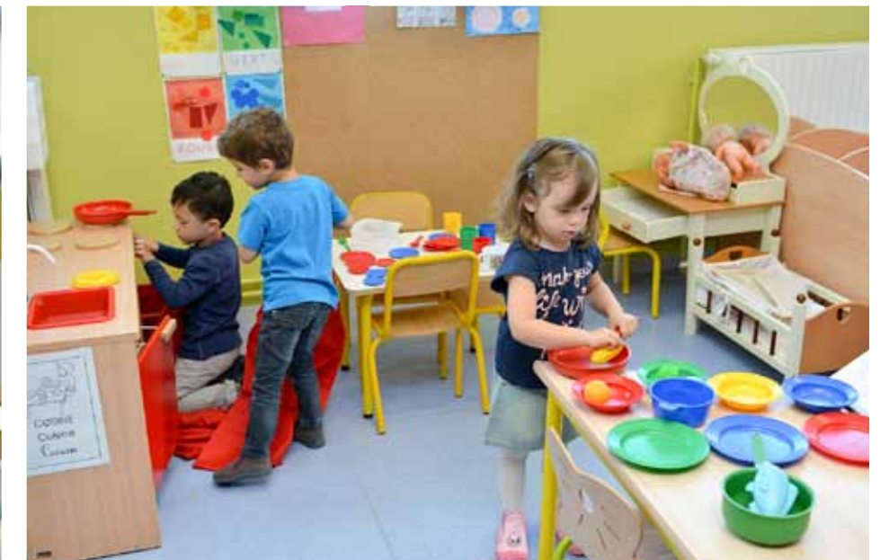
8 h 45 : Et si l'on préparait le repas de midi ?