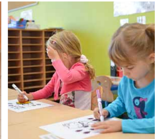
8 h 35 : Premiers coloriages pour les enfants de maternelle