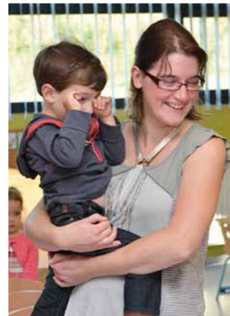
8 h 38 : On sèche ses dernières larmes...