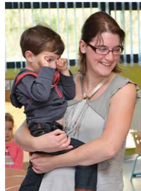
8 h 38 : On sèche ses dernières larmes...