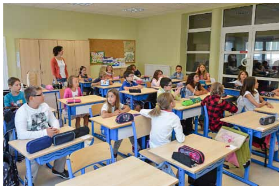
Les élèves de CE2-CM1 dans leur nouvel environnement

Au regard du nombre grandissant d'élèves à l'école primaire, il a fallu entamer dès le 22 avril les travaux de construction d'une nouvelle salle de classe en lieu et place de l'ancien préau. Les entreprises, sous la direction de l'architecte Bolzinger de Thionville, ont terminé le chantier le 30 août dernier, juste à temps pour la rentrée. Cette extension, réalisée en concertation avec Madame Engler, inspectrice de l'Éducation nationale, permet désormais de compter une vingtaine d'enfants par classe au lieu d'une trentaine les années précédentes. Un confort que savent apprécier enseignants et enfants ! Le maire tient d'ailleurs à préciser que « le village de Kanfen est l'une des rares communes à bénéficier d'une ouverture de classe cette année » dans le canton de Cattenom. Cette nouvelle salle de classe de 58 m 2 occupée par les CE2-CM1 de Madame Schrobiltgen est déjà équipée du fameux tableau blanc interactif. Ce support pédagogique dont