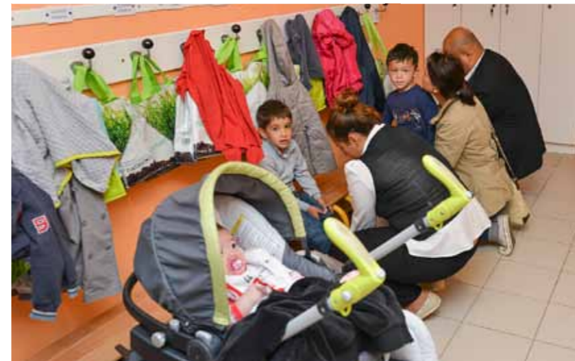
8 h 32 : « Dis maman, ils sont où mes chaussons ? »

du village, devient aujourd'hui un ensemble de bâtiments bien reconnaissable architecturalement mettant en valeur, ne l'oublions pas, des noms historiques à savoir Jean de Raville et Jeanne d'Autel.