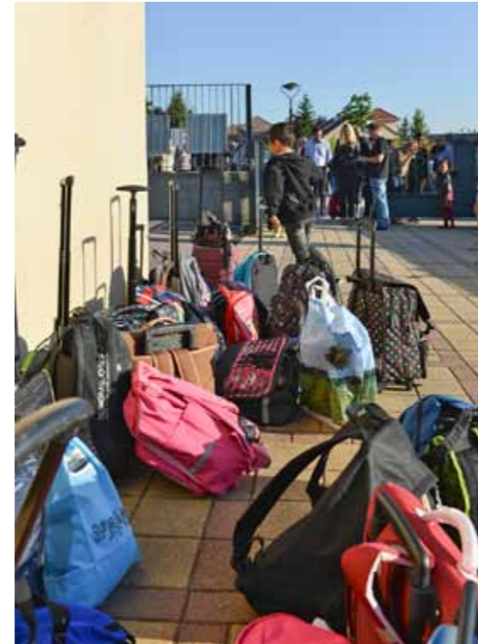
8 h 22 : Les cartables s'entassent devant l'entrée de l'école