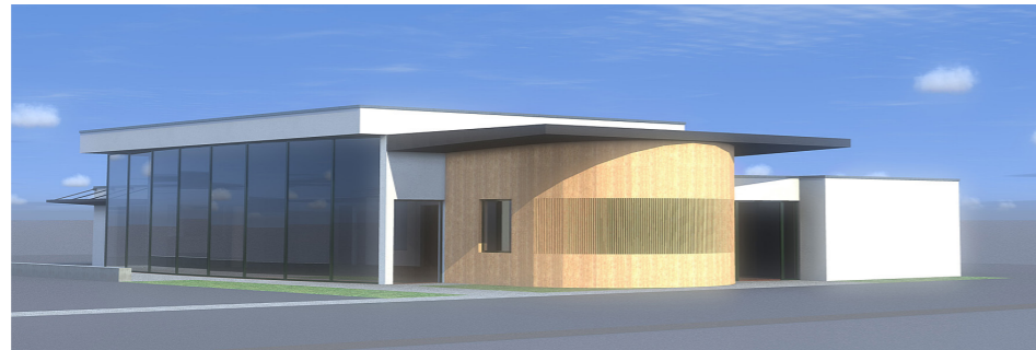
Vue de la future salle communale

Le site du projet fait partie d'un développement périurbain récent. Il s'agit de structurer l'espace compris entre la départementale et l'entrée historique de Kanfen. Les grands traits de cet aménagement ont été définis par la commune et je me suis inscrit dans cette trame.