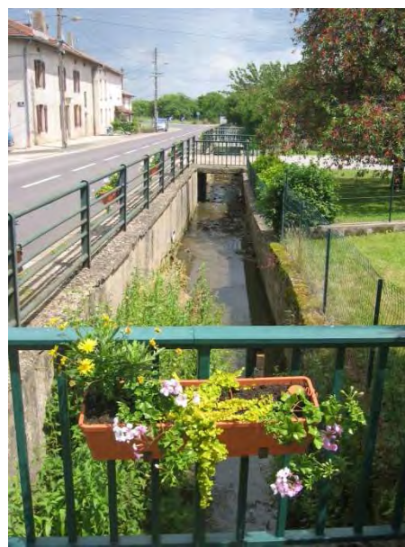
Rue de Zoufftgen

Originaires de Pange, couvées par les établissements Poussin, ces belles végétales marquent une étape très importante dans le choix d'une gestion durable des espaces verts et colorés. Pour compléter ces aménagements, dès l'automne, une nouvelle campagne de plantation d'arbres, d'arbustes à fleurs et de bulbes s'égrainera pour atteindre l'objectif recherché : Piquer de fleurs la ronde des mois. Par leurs couleurs, leur parfum et le graphisme de leur feuillage, elles attireront nos regards pour nous inviter au plaisir des sens et nous rappeler que, si comme elles, nous sommes éphémères, il y a toujours des bourgeons prêts à éclore pour que continue la vie.