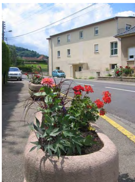
Rues de Zoufftgen et du Moulin