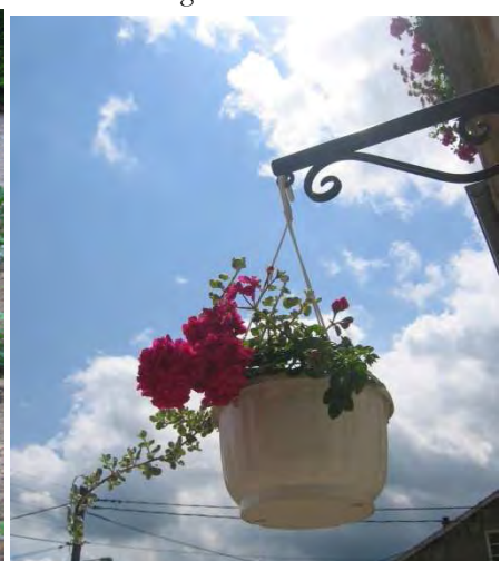
Rue de la Mairie