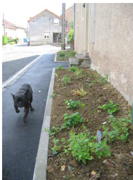
Rue de la République