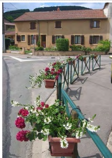
Devant la salle communale

Si le géranium, l'œillet et le bégonia n'ont pas été bannis, ce sont les plantes vivaces à fleurs qui parsèment désormais les massifs. Affublés d'un nom latin, l'Alchemilla, la Brunnera, la Campanula, l'Euphorbia et les Ibéris alternent avec la Gypsophila, la Tradescantia et bien d'autres pour coloniser nos pelouses avec la complicité des employés communaux mobilisés le temps d'un été pour que s'épanouissent feuilles, pétales et étamines multicolores.