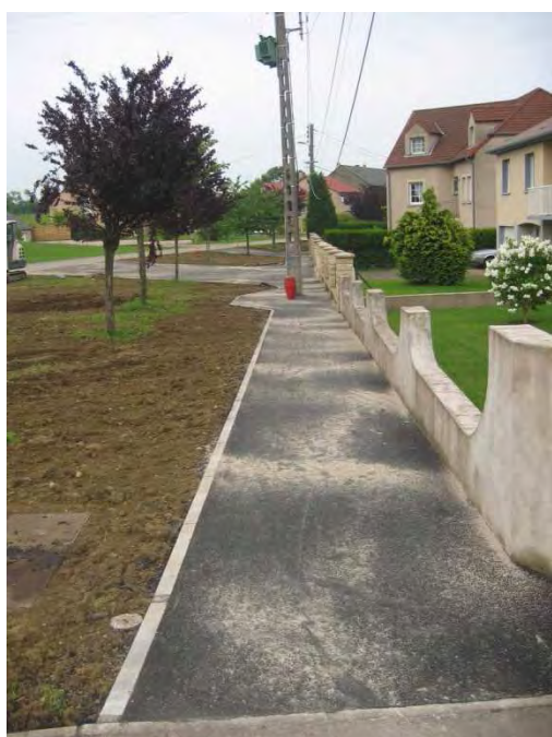
Rue de Zoufftgen