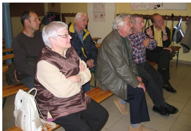
Kanfen-sous-Bois 03 octobre 2008