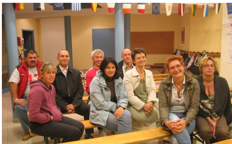
Cantevanne 17 septembre 2008

L'an prochain, les élus souhaitent relancer cette initiative en organisant trois nouvelles réunions publiques en rapport avec l'actualité du village.