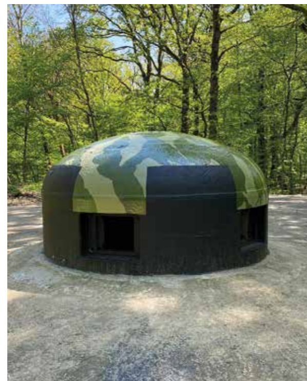
Tourelle GFM restaurée et peinture de la chambre de tir aux couleurs d'origine