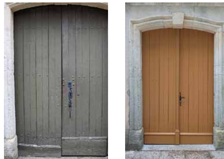
À gauche la porte avant rénovation. À droite la porte rénovée

Dans son état actuel, l'église Saint-Maurice de Kanfen date, pour l'essentiel de son aspect, du XVIII e siècle. Au fil du temps, de nombreux travaux d'entretien ont déjà été réalisés et notamment la réfection de la toiture et la remise en peinture de l'intérieur de l'église dans les années 80. Aujourd'hui ce sont les portes d'accès au bâtiment qui ont nécessité une attention toute particulière tant les dégradations étaient importantes. Le bois de la porte de la Sacristie se délitait et présentait des trous. Il a alors été décidé de la changer au vu de son état de détérioration avancé. La grande porte d'entrée à deux vantaux a été, quant à elle, restaurée. La partie basse, pourrie, a été changée et une peinture neuve a été appliquée à l'ensemble de la porte. C'est le Conseil de Fabrique de Kanfen, à qui incombe l'entretien des bâtiments dédiés au culte, qui a financé ces travaux de rénovation pour une somme d'environ 9 500 €. La menuiserie Vinckel d'Himeling s'est chargée de les réaliser.