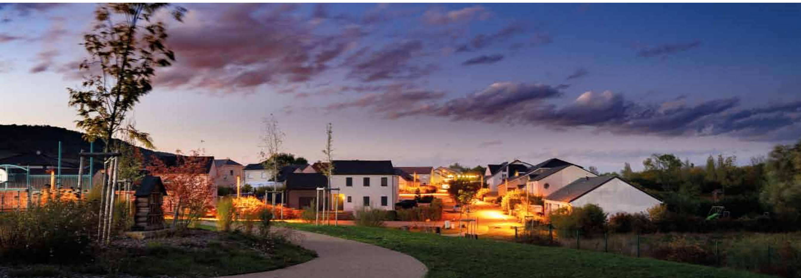
..... Le lotissement de Septfontaines à proximité du parc paysager