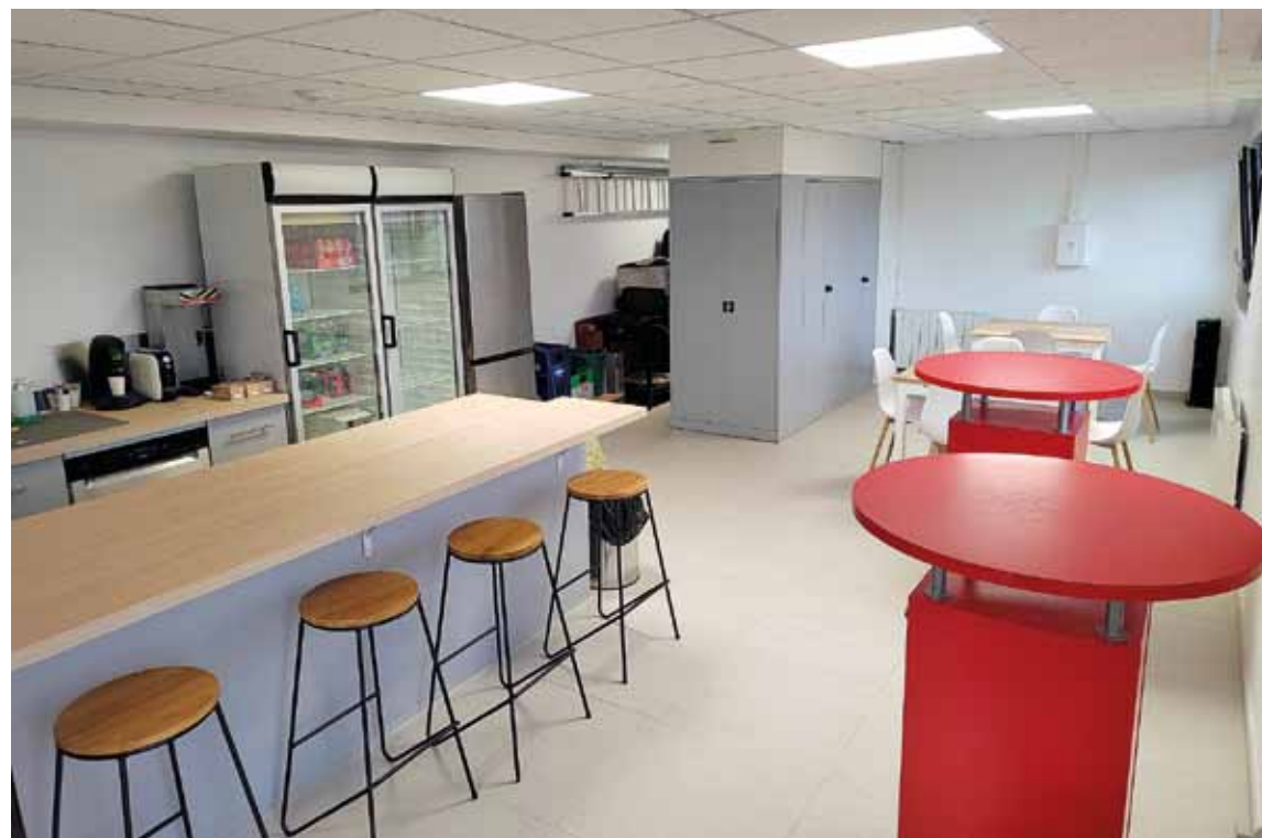
Club-house de l'association la « Pétanque Kanfenoise »