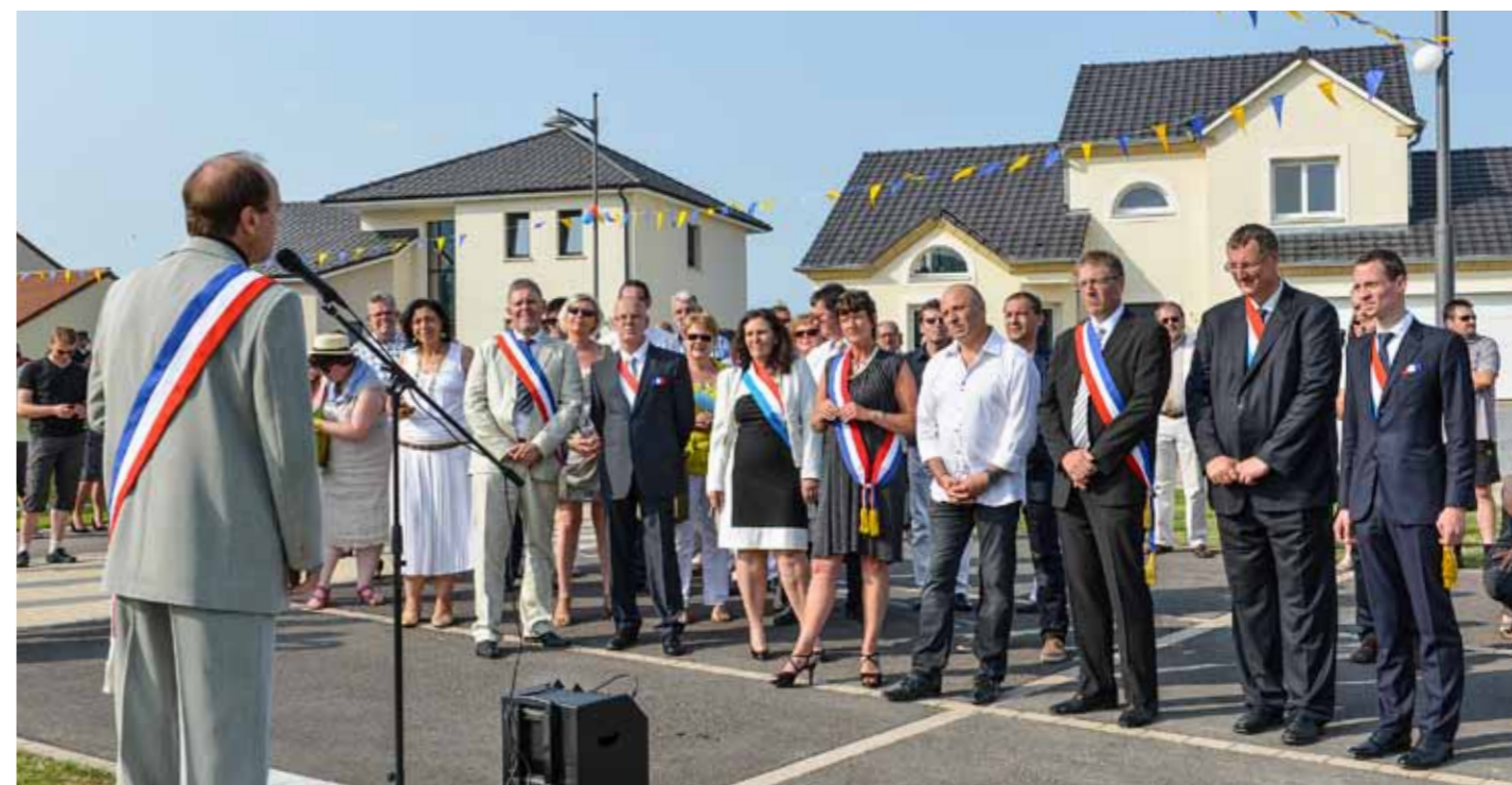
Roland Di Bartoloméo retrace l'histoire glorieuse de l'épopée italienne d'Henri VII et de Thomas de Septfontaines

entre deux communes qu'une frontière « administrative » sépare, mais qui sont liées par le sceau de l'histoire et qui établissent entre elles un lien irrémédiable qui se mue progressivement en une histoire d'amitié.