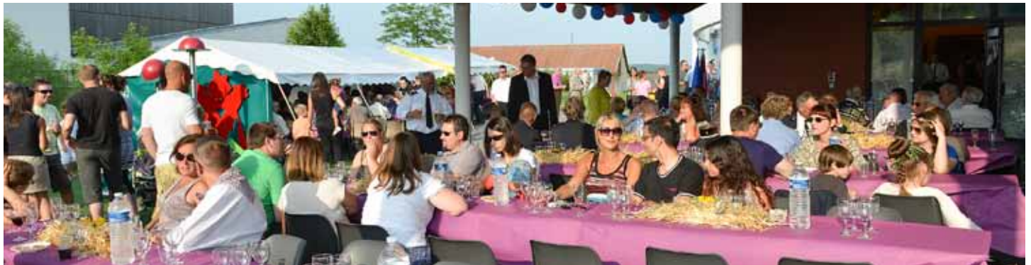
La fête de l'Amitié est toujours l'occasion de se retrouver autour d'une bonne table..

(extraits du discours prononcé par M. Roland Di Bartoloméo, professeur d'histoire et conseiller à la Mairie de Kanfen, lors de l'inauguration de la Boucle des Seigneurs de Septfontaines, le 13 juillet 2013).