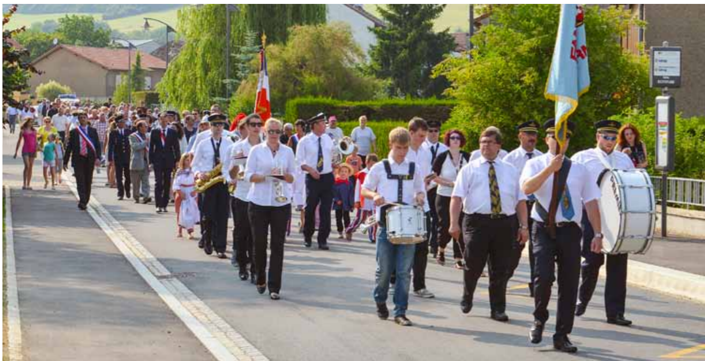
Le défilé, « Duerfmusék » en tête, traverse la rue de Gaulle en direction de la Boucle des Seigneurs de Septfontaines