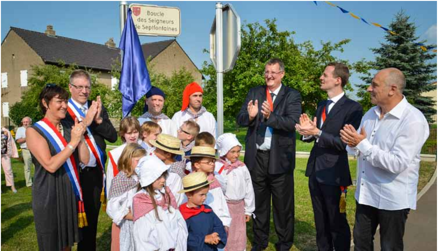
Inauguration de la « Boucle des Seigneurs de Septfontaines » (voir en pages intérieures)