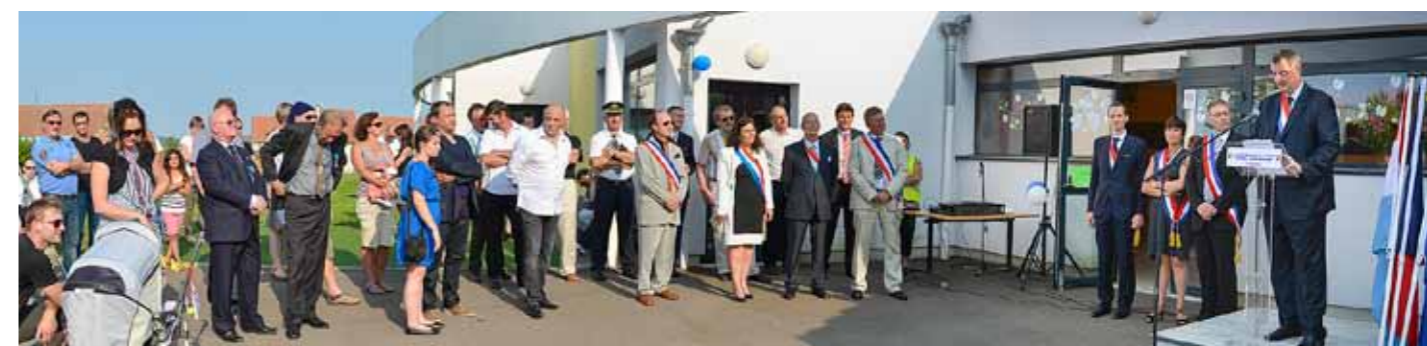
Les discours des officiels à l'école maternelle de Kanfen

Si vous allez un jour à Pise et que vous franchissez le rempart par la Porta Nuova pour pénétrer sur le Campo Dei Miracoli, vous verrez devant vous la magnifique cathédrale et la célèbre tour penchée qui n'est autre que le campanile, le clocher de la cathédrale. En entrant dans l'édifice, vous découvrirez dans le transept droit le somptueux cénotaphe d'Henri VII sculpté en 1315 par un des plus grands sculpteurs de l'époque, Tino Di Camaino. Mais à ce tombeau, il manque un groupe de cinq