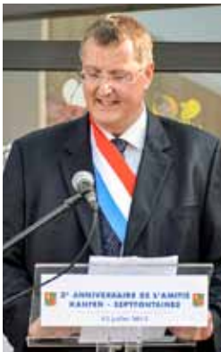
Marco Boly, Bourgmestre de Septfontaines