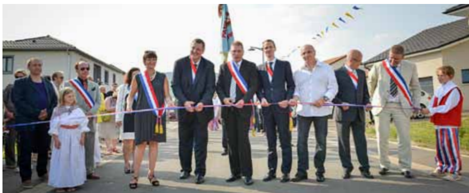
La Boucle des Seigneurs de Septfontaines officiellement inaugurée

Ce 13 juillet 2013 marquera sans nul doute un pas de plus dans le renforcement des liens historiques et amicaux