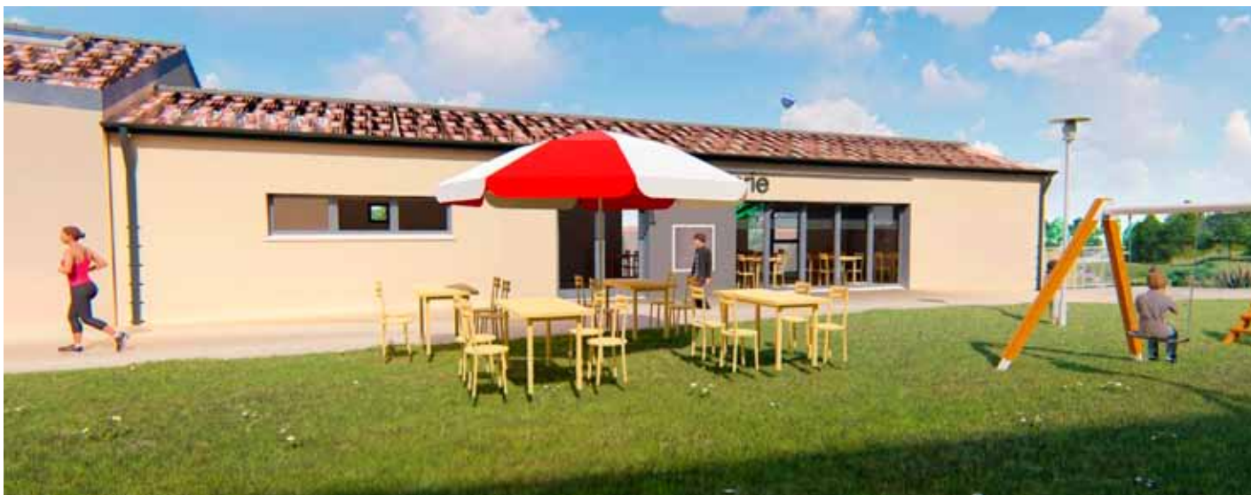
Vue 3D réalisée par le cabinet ID'architecture représentant la future cellule commerciale, le niveau inférieur constituera le local associatif.

Le permis de construire a été obtenu, les travaux vont bientôt commencer