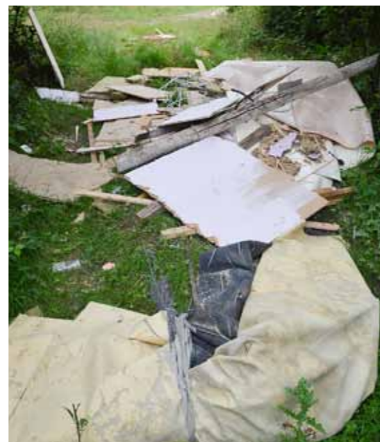
CARTE DES DÉPÔTS SAUVAGES