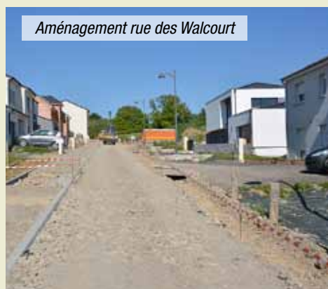
Aménagement rue des Walcourt