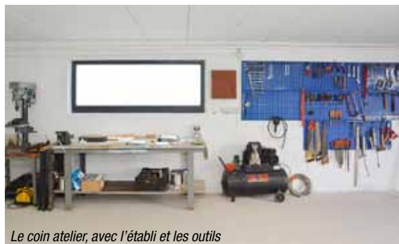
Le coin atelier, avec l'établi et les outils

Les agents des services techniques ne sont pas oubliés : des douches, vestiaires, sanitaires et coin repas sont également prévus.