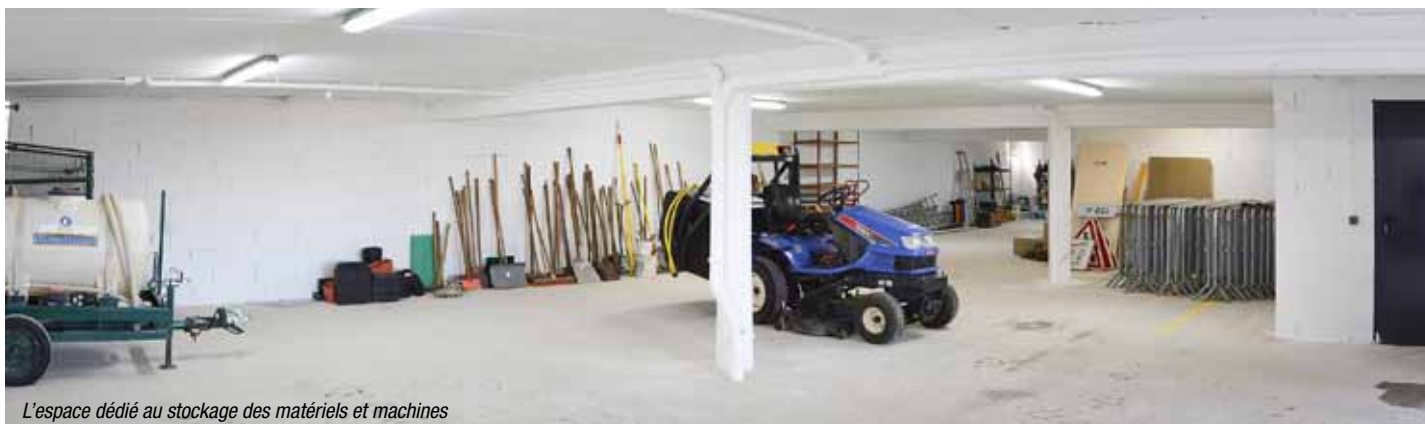
L'espace dédié au stockage des matériels et machines

300 m 2 situés au sous-sol des cellules commerciales, les services techniques enfin regroupés sur un même lieu