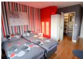
De gauche à droite : les hôtes des chambres « Aux Trois Frontières », la salle des petits déjeuners, la chambre « Moderne »