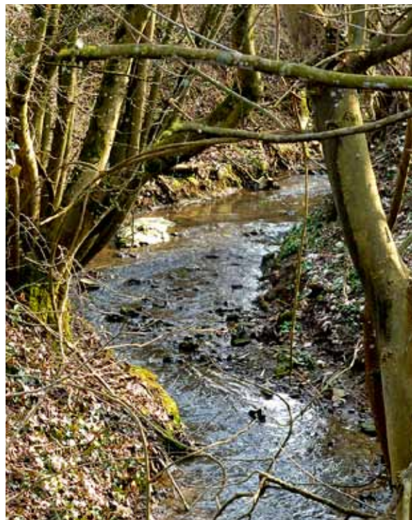
La Kissel à proximité de la rue portant le même nom à Kanfen

La présence d'une végétation restaurée contribue à maintenir des berges en bon état tout en recréant des conditions d'écoulement correctes. Cette restauration de la végétation a également permis de retrouver un auto-curage.