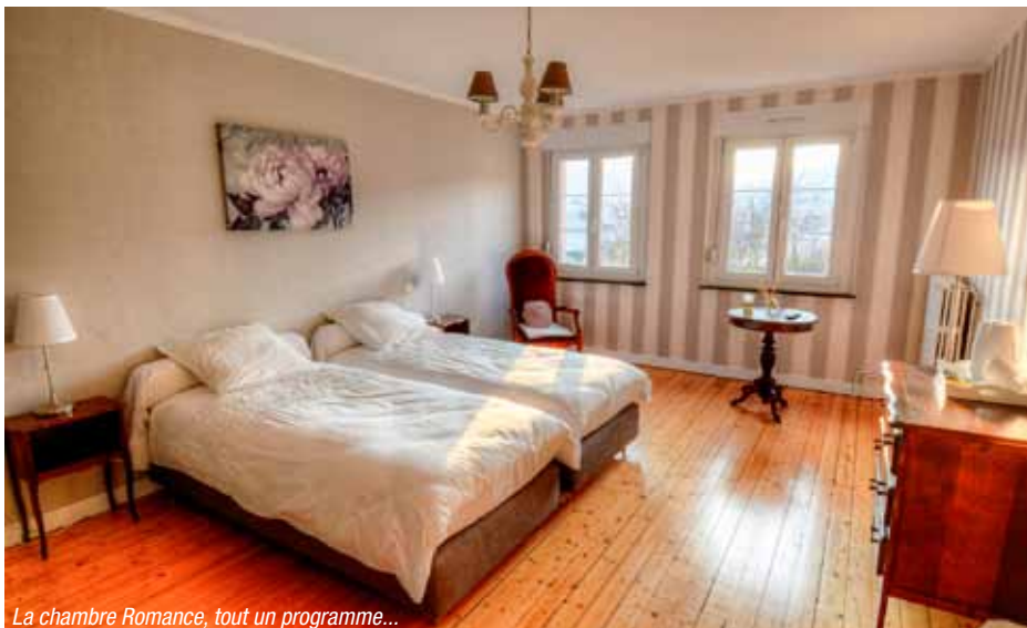
La chambre Romance, tout un programme...

Après un an d'activité, le bilan est très positif