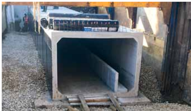
La voûte située sous la rue du Moulin sera remplacée par ce type d'ouvrage à une profondeur de 3,50 m sur 6 mètres de large.

Déplacement des réseaux enterrés avant destruction de la route sous-chaussée datant du 19 e siècle et remplacement de celle-ci par un ouvrage plus moderne (cf. : photo ci-dessous)